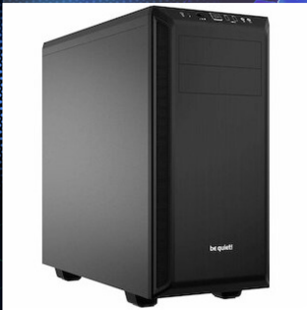
Captiva Workstation 159-097